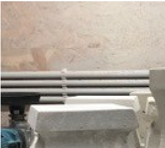
Kapiteel en basis van een pilaar van de klokkentoren

In het atelier van onze steenkapper is het houwen begonnen... duizend kilo witsteen van eigen Oost-Vlaamse bodem ondergaat deskundig geplaatste hamerslagen met beitels en bewerkingen met fijn gereedschap. De Amelgemse klokkentoren komt stilaan weer dichterbij. Pilaren, klokkenstoel, kruis, maar ook de twee eikelvormige siervazen links en rechts van de toren: elk element kent haar eigen traject.